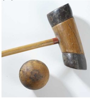
Cane de mail et sa boule