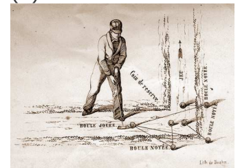
Ouvrage de J. Sudre (772)