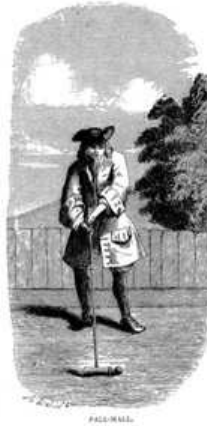
Ouvrage de Lauthier (1717)